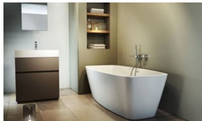
Esprit Baignoire îlot contre un mur