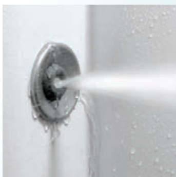
Buse latérale brumisante