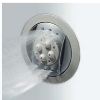
Buse dorsale hydro-brumisante