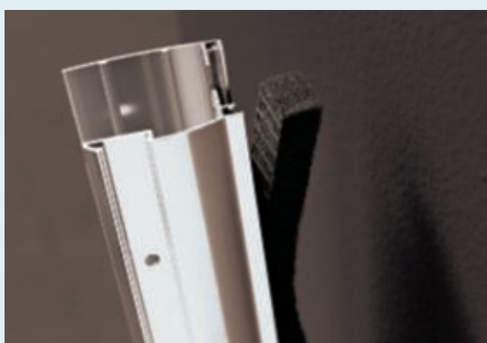
Etanchéité verticale : joint sur le profilé