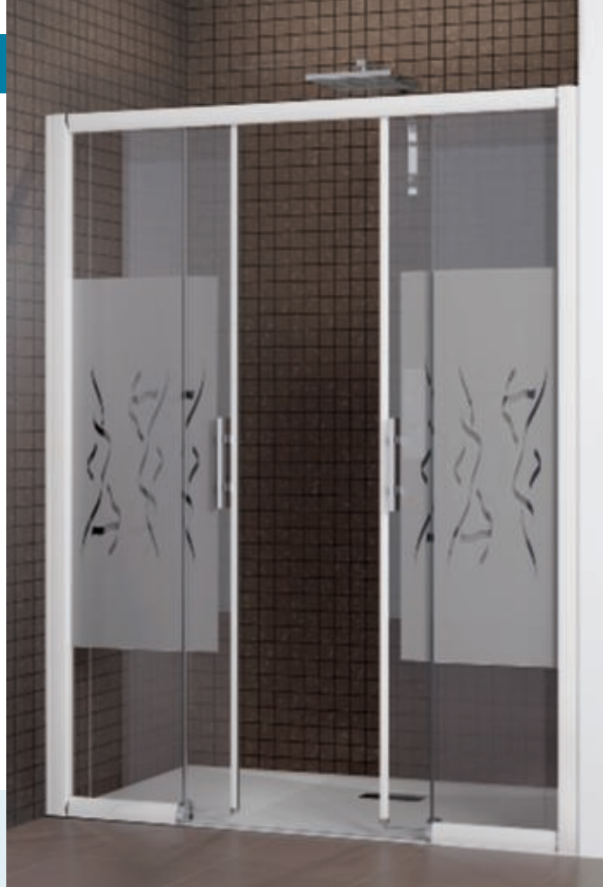
Macao XXL sans seuil - profilé blanc - verre dépoli flamenco