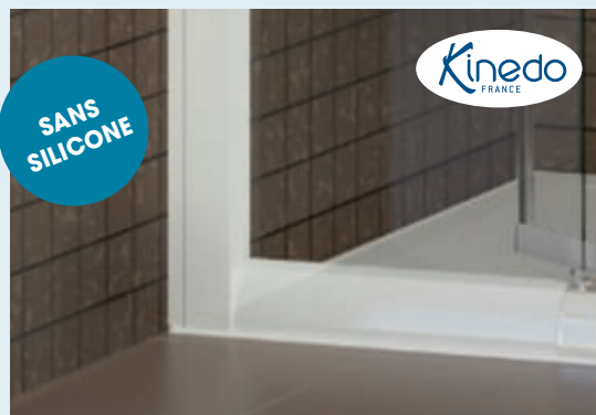
Montage sans silicone par Kinedo