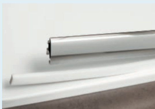
Etanchéité horizontale : joint sur le receveur

Rapport d'étanchéité du CSTB HES11-2603 2091-2