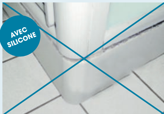
Montage d'une paroi avec joint silicone